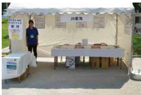
イメージ2017年JR東海ブース